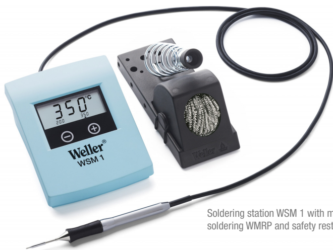
Soldering station WSM 1 with micro soldering WMRP and safety rest

Idéale pour les applications de soudage délicates sur site. Antistatique, elle est parfaitement adaptée aux laboratoires, aux ateliers de réparations et aux besoins industriels.